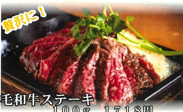
黒毛和牛ステーキ 100g 1718円 200g 3136円