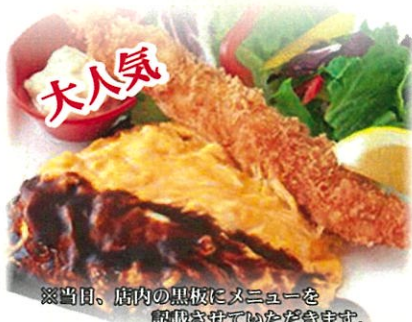
※当日、店内の黒板にメニューを 記載させていただきます。 レディースランチセット 907円