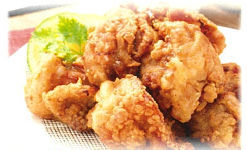
鶏の唐揚げ定食 791円